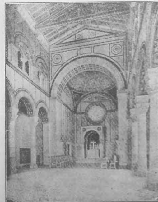
Crematorio de Leipzig.—Interior de la Cápila principal.