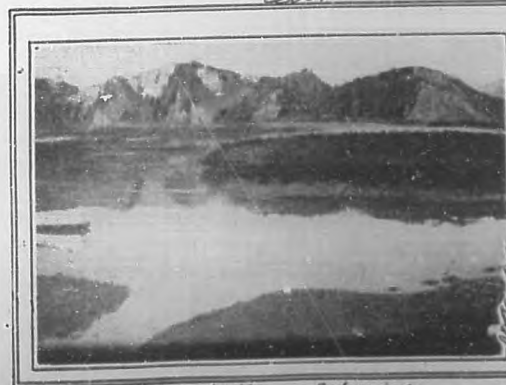
Rio Sella Asturias