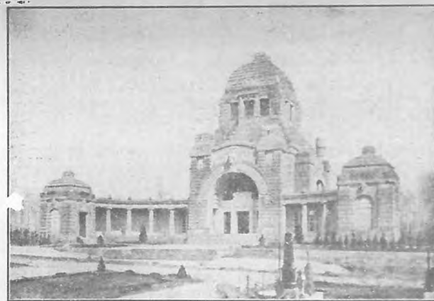
Fachada del crematorio del cementerio de Praga construido por el arquitecto Schalter.