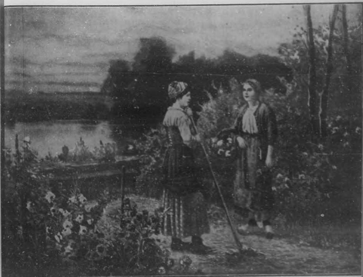
CAMPESINAS Cuadro de F. W. Gilbert