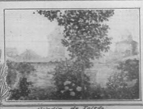
Jardin de Toledo.